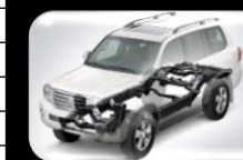
Estructura de carrocería (GOA)