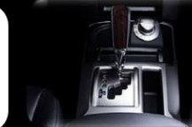
Automático 5 velocidades