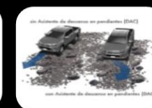
Sistema de arranque en Descenso (DAC)