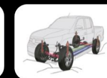
Control de tracción Activo (A-TRAC)