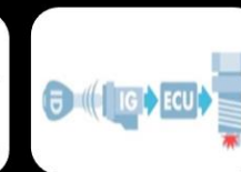
Inmovilizador de motor