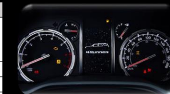
Panel de instrumentos Optitrón