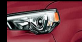
Rojo Mica Metálico