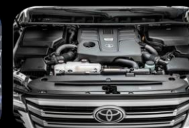
Motor V6 Twin Turbo de 3.5 L