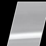
040 Super Blanco 2