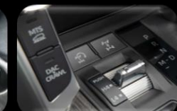
Panel de control para funciones todo terreno (4x4)