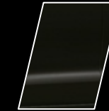
218 Negro Mica