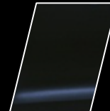
8X8 Azul Metálico