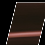
3Q3 Rojo Mica Metálico