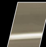
4V8 Bronce Metálico