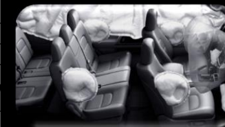
7 bolsas de aire