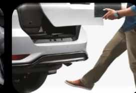
Compuerta trasera con sensor de apertura