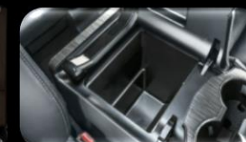
Consola de enfriamiento (Cool Box)