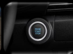
Encendido de motor inteligente