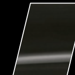
1G3 Gris Metálico