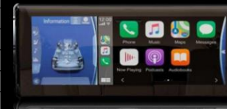
Pantalla de infoentretenimiento con Apple Car Play/Android Auto