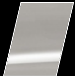
090 Blanco Perlado Precioso