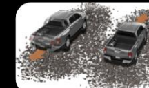
Sistema de arranque en pendientes (HAC)