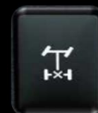
Bloqueador Dif. trasero