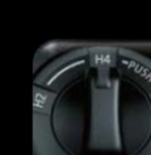
Swich de 4x4