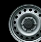
Rines 17 acero Versión MT