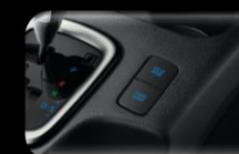
Modo ECO Versión AT