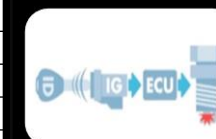
Inmovilizador de motor