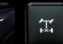
Bloqueador Dif. trasero