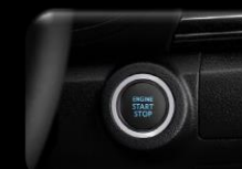
Botón de arranque