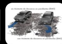
Sistema de arranque en Descenso (DAC)