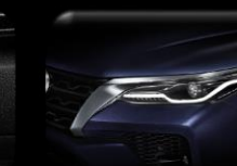
Luces Bi- LED