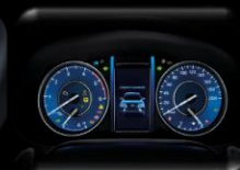
Pantalla TFT 4.2" multi-información