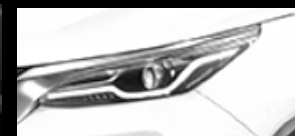
Súper Blanco II