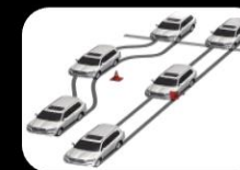
Frenos ABS con distribución electrónica de frenado (EBD)+ Asistente de Frenado (BA)