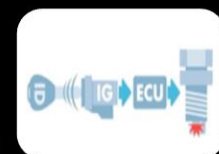
Inmovilizador de motor