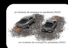
Sistema de arranque en pendientes (HAC)